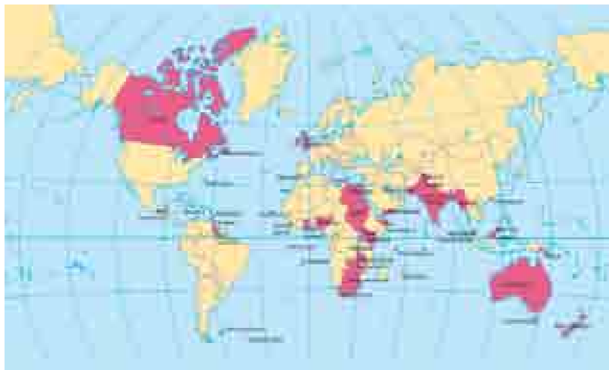
Illustration över världen kring år 1900 med det brittiska imperiet markerat med rött.

Det brittiska imperiet sågs som den mest framgångsrika av kolonialmakterna. När detta välde stod på sin höjdpunkt i början av 1900-talet omfattade det ca 25 % av jordens landyta och ca 30 % av världens befolkning samt utövade inflytande och kontroll även över stora delar av övriga världen, som t ex Brasilien, Iran och Kina.