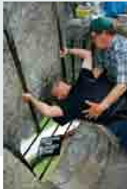
Use the Blarney way...

" Blarney Stone ", som utgör en del av Blarney Castle, anges som en sorts "ödessten" med anor från de tidiga irländska kungarna. Den som kysser stenen sägs få magiska krafter vad gäller charm och övertalningsförmåga. Den som har kysst stenen kan "snacka sig fram" till vad som helst, eller som man säger "Use the Blarney way". Irländare, oavsett om de kysst stenen eller ej, anses ha